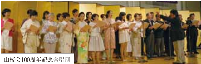
山桜会100周年記念合唱団

『山桜会100周年記念合唱団』は山桜会評議員で結成。小学校や大手前での10回の練習は歌唱指導もピアノも卒業生によるもので、皆さん毎回とても楽しく参加されていました。当日は、こちらも卒業生が作詞作曲し全国で歌われている『大切なふるさと』の歌詞を一部追手門バージョンに変更し、私達の大切な心のふるさとである追手門学院への思いを込めて精一杯歌わせていただきました。そして『偕行社附属小学校校歌』と『追手門学院学院歌』の参加者全員での大合唱は、会場が一体となる大感動の結びとなりました。