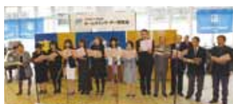
大学校友会総会に出演

一度だけで終わるのは惜しいという声があり、11月6日の大学校友会総会にもお招きいただき、今後も合唱団は続いていく予定です。