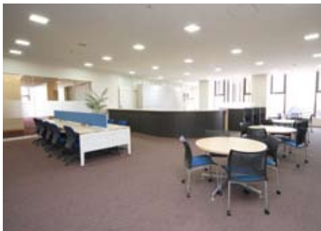
④ サテライトオフィス大手前