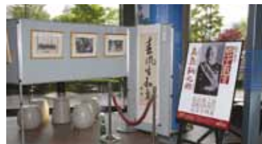
維新ふるさと館の高島鞆之助記念企画展

127期生は、4月15日早朝に大阪国際空港に集合し、空路鹿児島に向かいました。到着後、仙巖園、知覧特攻平和会館を見学し、歴史資料館である維新ふるさと館に向かいます。その後高島鞆之助先生の誕生地を訪れ、没後百周年の式典で献花式を行い、高島先生の碑の前で追手門学院小学校児童としての決意を新たにしました。