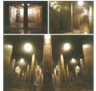
国土交通省関東地方整備局江戸川河川事務所

春日部市というと、『クレヨンしんちゃん』しか頭に浮かんでこなかったもので、とても勉強になりました。参加した会員はバスで東京丸の内まで帰り、たくさんの窓が照明で光っている夜の高層ビル群を背景にして、圧巻の地下神殿の感動を胸に、それぞれ家路にたどり着くのでした。