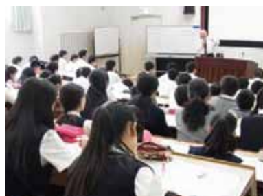
「将来を考える日」の一講義

また、6月には、茨木・大手前の各中高において、恒例の「将来を考える日」を開催します。社会で活躍する様々な卒業生が、後輩である中高生に対し、仕事の話、仕事に就くまでの経緯など講師としてお話しします。現役生徒にとっても卒業生にとっても「こころのふるさと」を再確認する機会となると思えます。また、本年度は、これに加えて、NASAの本宇宙飛行士による講演も予定しております。この方は卒業生ではありませんが、お話しを踏まえて「人として必要な根源的なこころや考え方」を考えましよう。