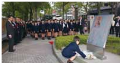
誕生地記念碑への献花

平成3年9月4日、「高島鞆之助先生誕生地記念碑」除幕式が鹿児島市甲突川の河畔で行われました。正確な誕生地から50m程で河川公園の最も環境の良い場所を、鹿児島市よりご提供いただきました。創立百周年を記念した修学旅行として、102期生が創設者の誕生地である鹿児島を訪問した卒業記念品として建立したものです。鹿児島中央駅から徒歩5分、甲突川右岸の記念碑の対岸には西郷隆盛、大久保利通の誕生地碑があります。