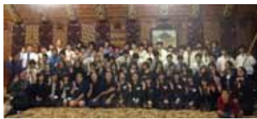
中学3年ニュージーランド修学旅行

2014年度に卒業した生徒は、京大医学部をはじめ難関大学への進学実績において、よく健闘してくれました。しかし、