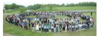
高校2年北海道修学旅行

今年度も「あたたかみのある進学校」として、目の前にいる生徒諸君のために教育活動に邁進してまいります。今後とも、皆さまのご支援をお願い申し上げます。