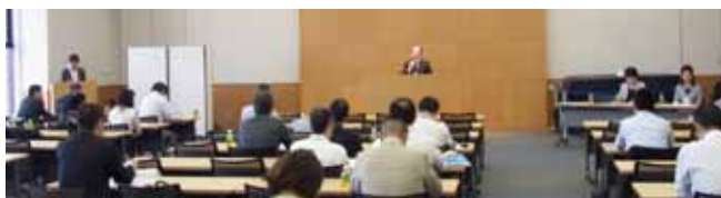
26年度第2回評議員会

この「人として必要な根源的なこころや考え方」は、追手門の中でも、時代や出身校などによっても異なるかもしれませんが、今後さらに一年間かけていろいろな卒業生のお話や企画などによってより具体化していきたいと考えています。