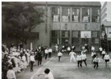
木造校舎とクスノキ・昭和34年頃

さて、大手前中高の校庭にあったクスノキについてお尋ねがありました。現在、南館と呼ばれる校舎が建つ前の木造校舎の角辺りに植わっていた立派な樹のことです。登って先生に怒られた方もいらっしゃるのではないのでしょうか？