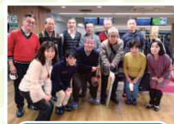
ボウリング同好会