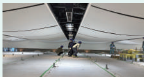
写真② 天井膜確認時の様子

2014年の改正建築基準法に対応するため、既存不適格となった天井を全面撤去し、軽量柔軟な膜天井への改修を行いました。工事期間は2022年5月9日から2023年2月24日の約10か月間でした。工事進行中は、一級建築士の立ち合いのもと、工事現場で作業の進捗や機器の設置状況を確認してきました。皆様に工事の様子と完成の姿をお知らせいたします。