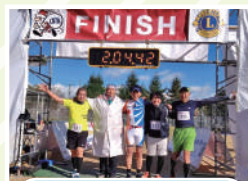
ランニング同好会