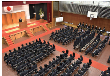
大手前高校入学式