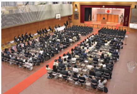
大手前中学入学式

このように私達追手門学院大手前の生徒・保護者・教職員一同は2023年度もお互い知恵を出し合って、皆が幸福になることのできる学校を目指してまいります。引き続きご支援ご協力のほど、よろしくお願い申し上げます。