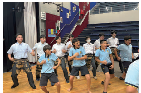
ニュージーランド研修