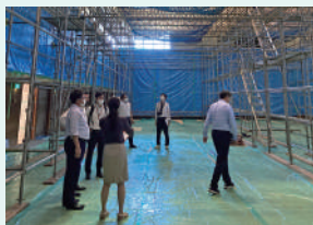
写真① 工事初期段階の現場