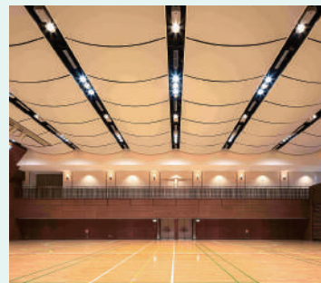
写真③ 完成直後の110記念ホール

写真① 工事初期段階の現場。天井付近まで足場を組んでいます。 写真② 天井膜確認時の様子。丈夫な布製です。天井裏は黒く塗装され、下から見上げただけでは内部が見えることはありません。 写真③ 完成直後の110記念ホールです。立派にリニューアルされ次の時代に引き継がれていきます。