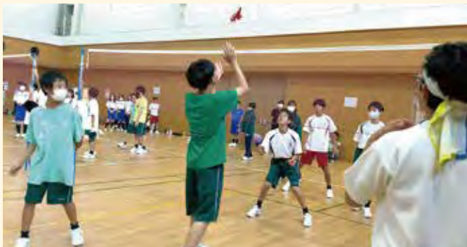
インディカ(中学丸郷行事)