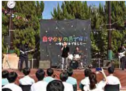
大手前中高 錦城文化祭