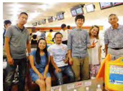
2013年8月開催ボウリング大会