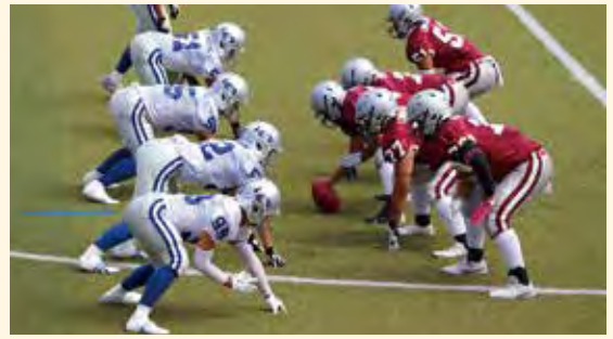
アメリカンフットボール部

日々高い志の下、種目間だけでなく競技を越え、様々な場面でスポーツを通して切磋琢磨している成果ではないかと感じています。山桜会の会員の皆さま、全国大会で活躍する後輩たちに熱烈な声援をお願いします。