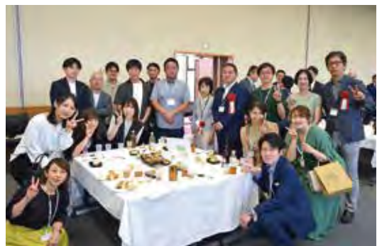
笑顔溢れる3年振りの懇親会・40歳同窓会