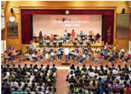
大手前中高 錦城文化祭

令和4年にスタートしたグローバルコース(GA/GS)は今年2年目を迎えました。11月には2年生GAコースがシンガポール・マレーシアにGSコースが久米島(沖縄県)にそして1年生は12月にグローバルコース全員で台湾に探究旅行に出かける予定です。これからも創意工夫を続けながら、幸福を追求できる思慮深い人材を育ててまいります。詳細については是非、本校のホームページをご覧ください。よろしくお祈りします。