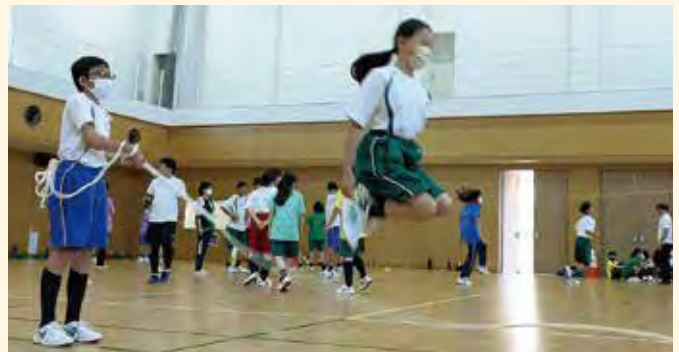
大縄跳び(中学丸郷行事)