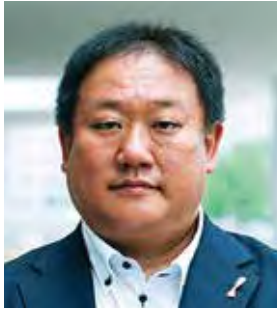
追手門学院 高校教頭(兼中学教頭)