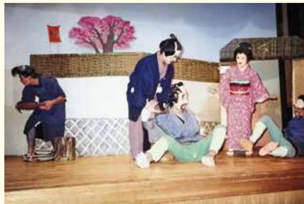
旧講堂時代の文化祭職員劇