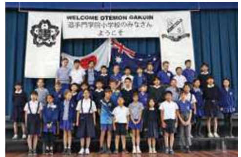
オーストラリア姉妹校 訪問