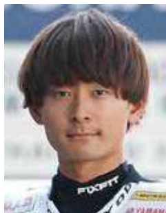
プロライダー 南本 宗一郎 (大手前中高66期)