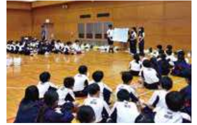
オリエンテーション合宿

2024年度が始まりました。追手門学院校友会山桜会の皆様には、平素より本校の教育活動の推進にご理解とご支援を賜り、心より感謝申し上げます。