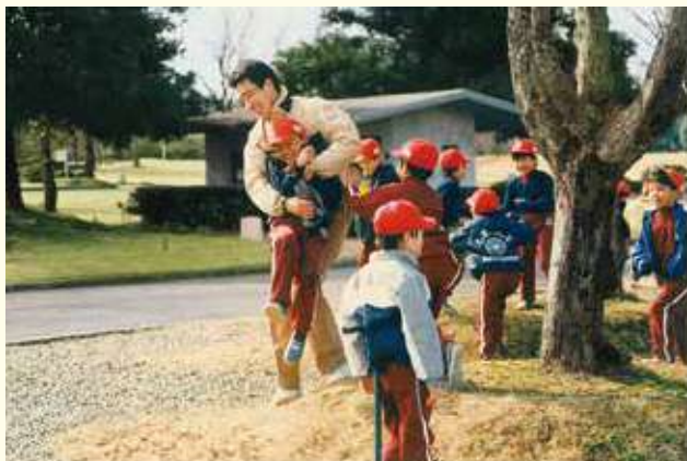
偕行社時代から続いた耐寒遠足(万博記念公園)