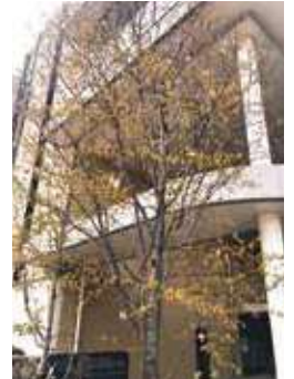
山桜エントランス

日頃は小学校教育に多大なるご支援を賜り誠にありがとうございます。4月に入り山桜エントランスにある山桜がちらほらと花を咲かせました。コロナ禍も明け、小学校では5年ぶりに穏やかな新年度を迎えることができました。3月の135期生卒業式、4月の141期生入学式、それぞれ制限なく多くの方々にご臨席賜り、華やかな式となりました。