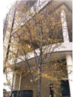
山桜エントランス

日頃は小学校教育に多大なるご支援を賜り誠にありがとうございます。4月に入り山桜エントランスにある山桜がちらほらと花を咲かせました。コロナ禍も明け、小学校では5年ぶりに穏やかな新年度を迎えることができました。3月の135期生卒業式、4月の141期生入学式、それぞれ制限なく多くの方々にご臨席賜り、華やかな式となりました。