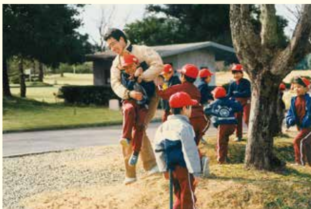
偕行社時代から続いた耐寒遠足(万博記念公園)