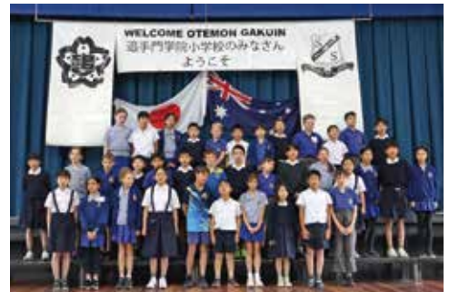
オーストラリア姉妹校 訪問