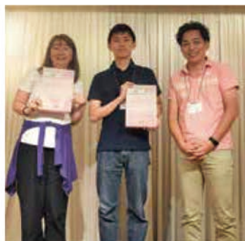
ボウリング大会表彰式