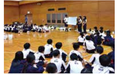
オリエンテーション合宿

2024年度が始まりました。追手門学院校友会山桜会の皆様には、平素より本校の教育活動の推進にご理解とご支援を賜り、心より感謝申し上げます。