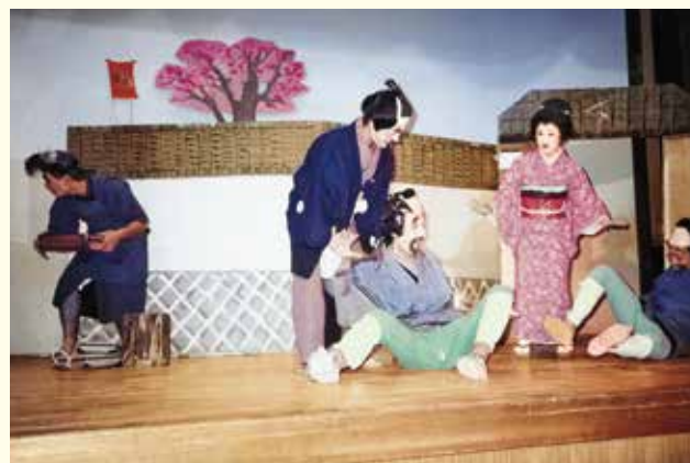
旧講堂時代の文化祭職員劇