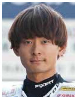
プロライダー 南本 宗一郎 (大手前中高66期)