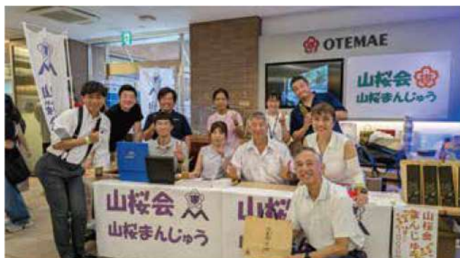
大手前中高 錦城文化祭にて