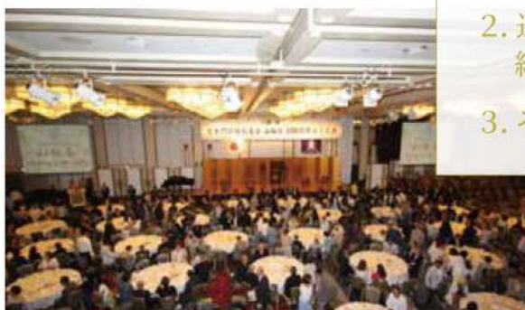
100周年記念式典の様子