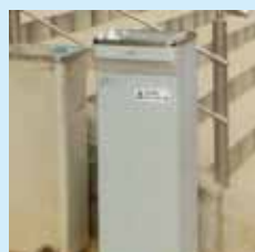
ウォータークーラー