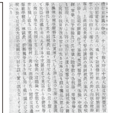
「私立大阪教育会雑誌」97号 1894年(明治27年) P9(原文引用)