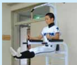
シットアップジム