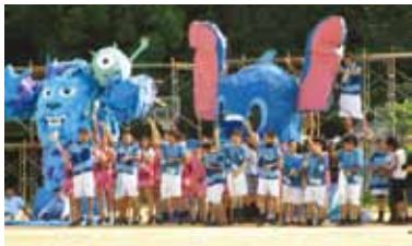
安威祭デコレーション

お蔭さまで、今年もクラス数が増え、高1と高2がそれぞれ11クラスになりました。中学校の8クラスと合わせれば、38クラスという大規模の学校になってきました。中学のニュージーランド修学旅行も3クラスの規模で行っています。中学の全体行事は、高校の学年行事に匹敵する規模になりました。PTA保護者の来校数も年々増え、2学期恒例の安威祭も盛況に開催することができました。