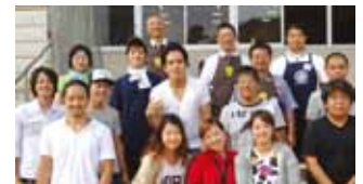
山桜会ソフトボールチーム 3位