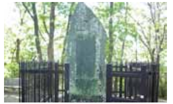
茨木耳原公園・幣山記念碑

今回はその石碑の清掃と拓本を行いました。石碑の表にある銘文は古くは「明治天皇大阪行幸誌」P8~9(大正10年大阪市役所発行)にも掲載されています。