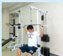
ラットプルマシン