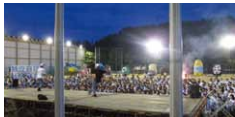
安威祭ファイナルステージ

来年度からは高校のII類の中に『表現コミュニケーションコース』が新設されます。現代社会に求められる「表現力」「コミュニケーション力」を育む先進的なコースとして期待をしていますし、学校がさらに活性化していくことと思います。このように活気に溢れた校内の様子を、卒業して久しい皆さま方も、是非一度時間を作って覗いてみられてはいかがでしょうか？